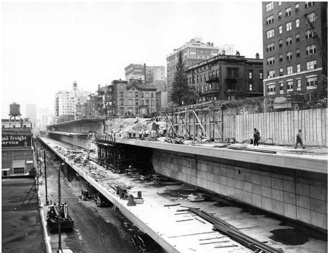
Et Brooklyn Heights, 1925...