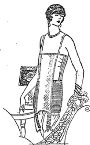
Duosette model sketched

Most Careful Attention Given to Fittings.