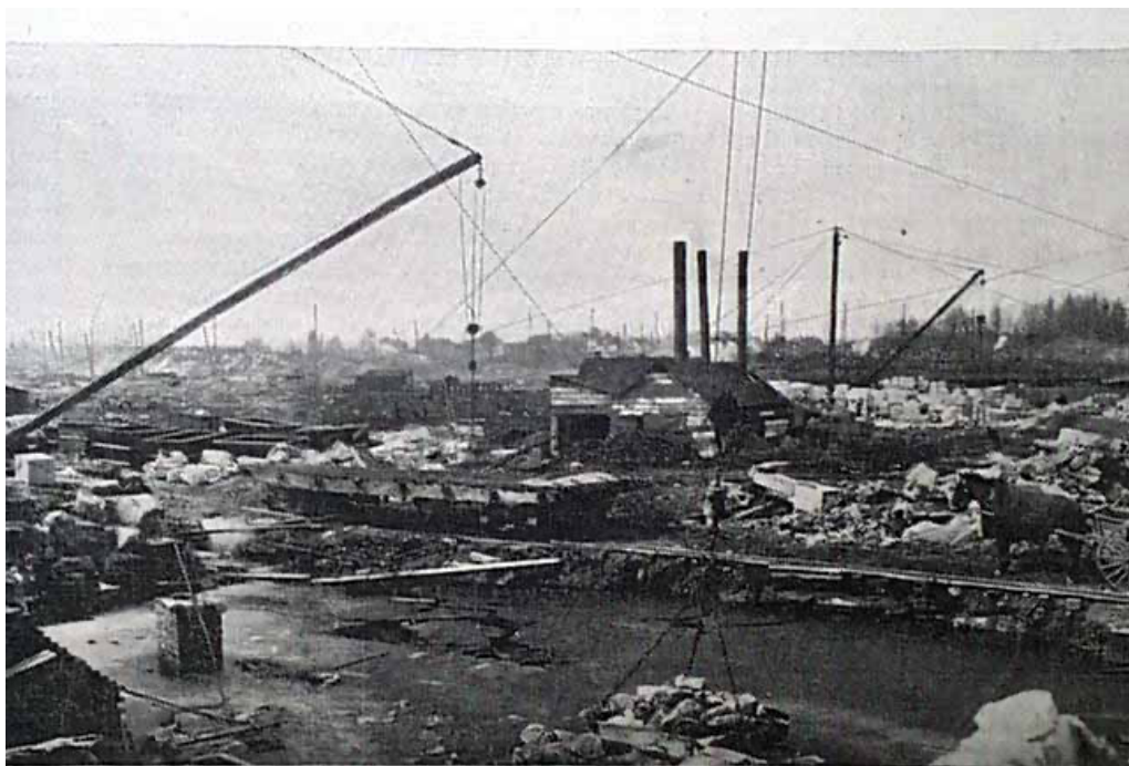
Panoramic View of the Work, with Triple Aqueduct in Foreground.

n'y a pas plus patriotes que les citoyens de Brooklyn, et que leur plus haut désir est qu'on le comprenne bien, a dit le général Wingate. Nous sommes ici pour prouver notre confiance envers les institutions établies, et notre conviction que ceux qui cherchent à les renverser devraient être renvoyés là d'où ils viennent. »