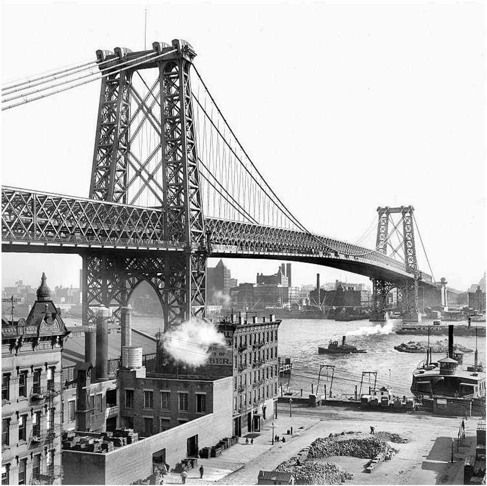
Williamsburg Bridge, 1925.