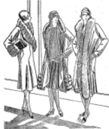
Evening dress, $119.00. Alkali dress, $119.00. Alkali dress, $119.00.

"THE KINETIC SILHOUETTE," IT IS CALLED—INTERPRETED AT MACY'S in the FLUID LINES of FLARES, GODETS and RIPPLING HEMS