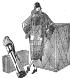
Werner's and Macy's Coat Department. $149.00.

Trimming detail is therefore more elaborate. Gold is frequently used. And silver, too. Embroideries appear in more decorative treatments. And velvet takes precedence in the mode.