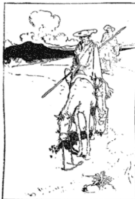
"Don Quixote Went on His Way Exceedingly Proud."

Three Illustrations Are by W. Heath Robinson and Were Drawn by Him for "Don Quixote," Translated by Charles Jarvis. Doubt, Mead & Co.