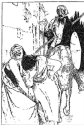
"They Could Not Contain Their Laughter."

THAT NOBLE KNIGHT WHO "SMILED SPAIN'S CHIVALRY AWAY"