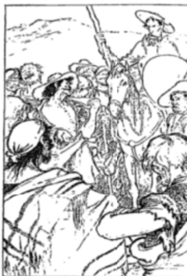
"Come de Panamint Assured for Them All."