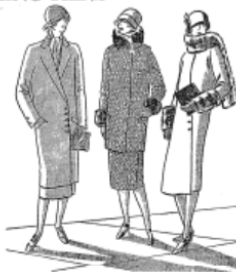
Werner's and Macy's Dress Department. $119.00. Alkali dress, $119.00. Alkali dress, $119.00.