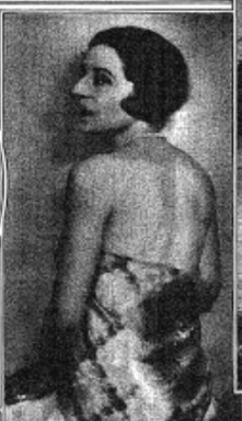
STANDS IN A NEW COSTUME, THE Tabala Changlin. From a New Studio Portrait Made in Vienna.