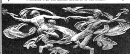
ONE OF THE COMPANION RELIEFS of a Fine Sculpture Group (The Young Woman) Four Years Ago for the Museum