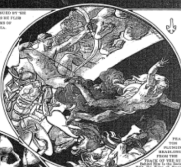
PROMETHEUS TORTURED BY THE EAGLE: ONE OF THE LABORS OF HERCULES, AS DESCRIBED IN ONE OF THE TWELVE LABORS

A Master's Last Work: John Singer Sargent's Mural for the Boston Museum of Fine Arts, Unveiled Last Week. The Present Collection Com- prises Eighteen Murals, Twelve Frescoes and Six Reliefs, and Supplements the System Mur- als installed in the Rotunda of the Museum in 1922. The Des- ign and Coloring of the New Set is a Golden Ode to the Background of Man.