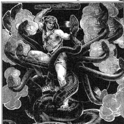
HERCULES AND THE HYDRA: ONE OF THE TWELVE LABORS