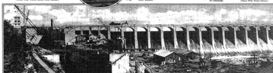
THE "WIDE GATE" OF THE YEMMERSE RIVER VALLEY. THE COMPLETED WILSON DAM, BUILT EIGHT YEARS AGO AND WHICH NOW STRETCHES AS