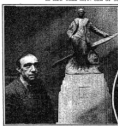
TO A PRIMER OF AVIATION: FRENCH ENGINEER. French Engineer, with his hand on the monument to himself Gives, in the presence of the Mayor of the Republic, the first, the first of the Republic.