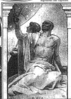
HERCULES, AS A YOUNG MAN, IS A RELIEF SCULPTURE, ONE OF THE LABORS OF HERCULES, AS DESCRIBED IN ONE OF THE TWELVE LABORS