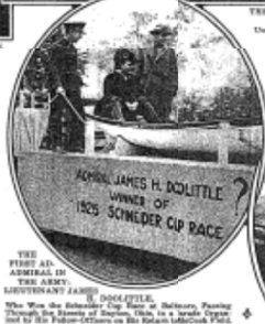
THE FIRST AIR ADMIRAL IN THE ARMY. ADMIRAL JAMES H. DOOLITTLE. Who Was the Commander of the Fleet at Baltimore, Porting Through the Straits of Dover, then in a single day and in the future officers on the Island of the