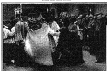
AT THE DEDICATION OF THE FIRST CATHOLIC HIGH SCHOOL IN NEW YORK CITY. ONE OF THE RITES.