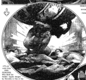
ATLAS AND THE HEAVENS: ONE OF THE LABORS OF HERCULES, AS DESCRIBED IN ONE OF THE TWELVE LABORS

A Master's Last Work: John Singer Sargent's Mural for the Boston Museum of Fine Arts, Unveiled Last Week. The Present Collection Com- prises Eighteen Murals, Twelve Frescoes and Six Reliefs, and Supplements the System Mur- als installed in the Rotunda of the Museum in 1922. The Des- ign and Coloring of the New Set is a Golden Ode to the Background of Man.