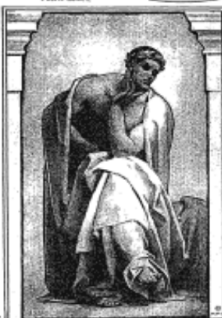
PROMETHEUS, AS A YOUNG MAN, IS A RELIEF SCULPTURE, ONE OF THE LABORS OF HERCULES, AS DESCRIBED IN ONE OF THE TWELVE LABORS