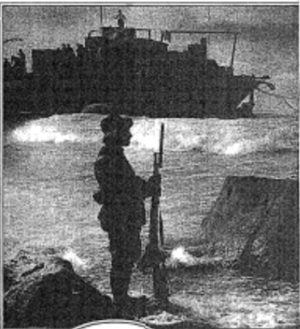
THE SPANISH ARMY CITY RECOVERED Used for Landing Troops at Spain. (From N.Y.)