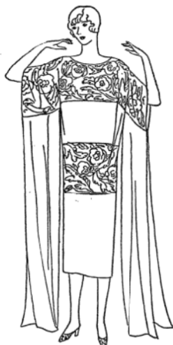
Very rich in effect is a tea gown of crepe de Chine combined with brocaded velvet, and delicately trailing long sleeves of airy chiffon. Sale price, 18.50