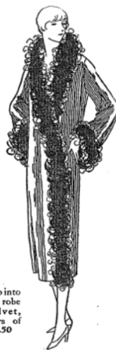
Soft and inviting to slip into is a graceful boudoir robe of tinselled cut velvet, trimmed with borders of ostrich. Sale price, 18.50