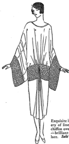
Exquisite in its clever drapery of line is a negligee of chiffon over crepe de Chine—brilliant with wide silver lace. Sale price, 18.50