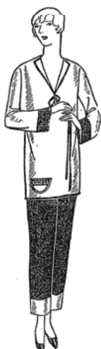
A debonair little smoking suit combines a slip-over jumper of lustrous gold satin with trousers of red or green satin. Sale price, 18.50

NEGLIGEE DEPARTMENT—SAKS-FIFTH AVENUE—FOURTH FLOOR