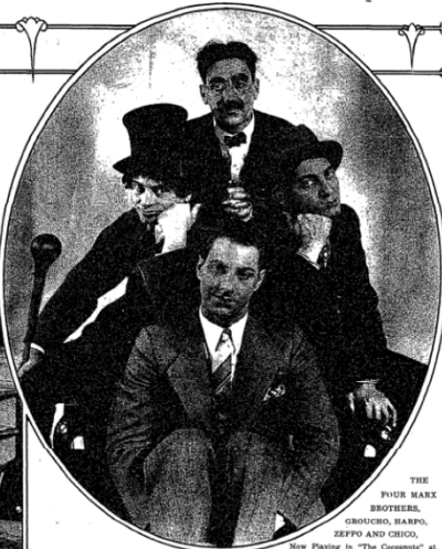
THE FOUR MARK BROTHERS, GROSCH, BARFO, ZEPPO AND CHICO, Now Playing in "The Comedians" at the Lyric Theatre.

After Their Wedding in St. Peter Church, Where They Were His (U. S. A.)