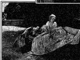
"LE CHAVALIER A LA ROSE": JACQUES CATELAN, the Vegetarian of France, With Requests Dishes of the Garden of Versailles, in a Scene From the Film Version of the Opera Taken in the Gardens of Schlossbrunn in Vienna.