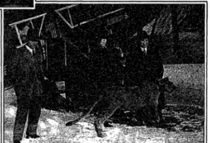
BESSIE, THE FLYING LIOSER: ONE OF A VAUDEVILLE TROUPE OF TRAINED ANIMALS, the First to Make the Trip From Paris to London by Air, Gave Aboard the Plane at Le Bourget.