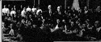
BOYS' BIES IN BLACK SHIRT: PREMIER at a Luncheon Which He Gave at the Palazzo Durio Fungitelli in Rome for 500 King of Italian Soldiers Killed in the War.