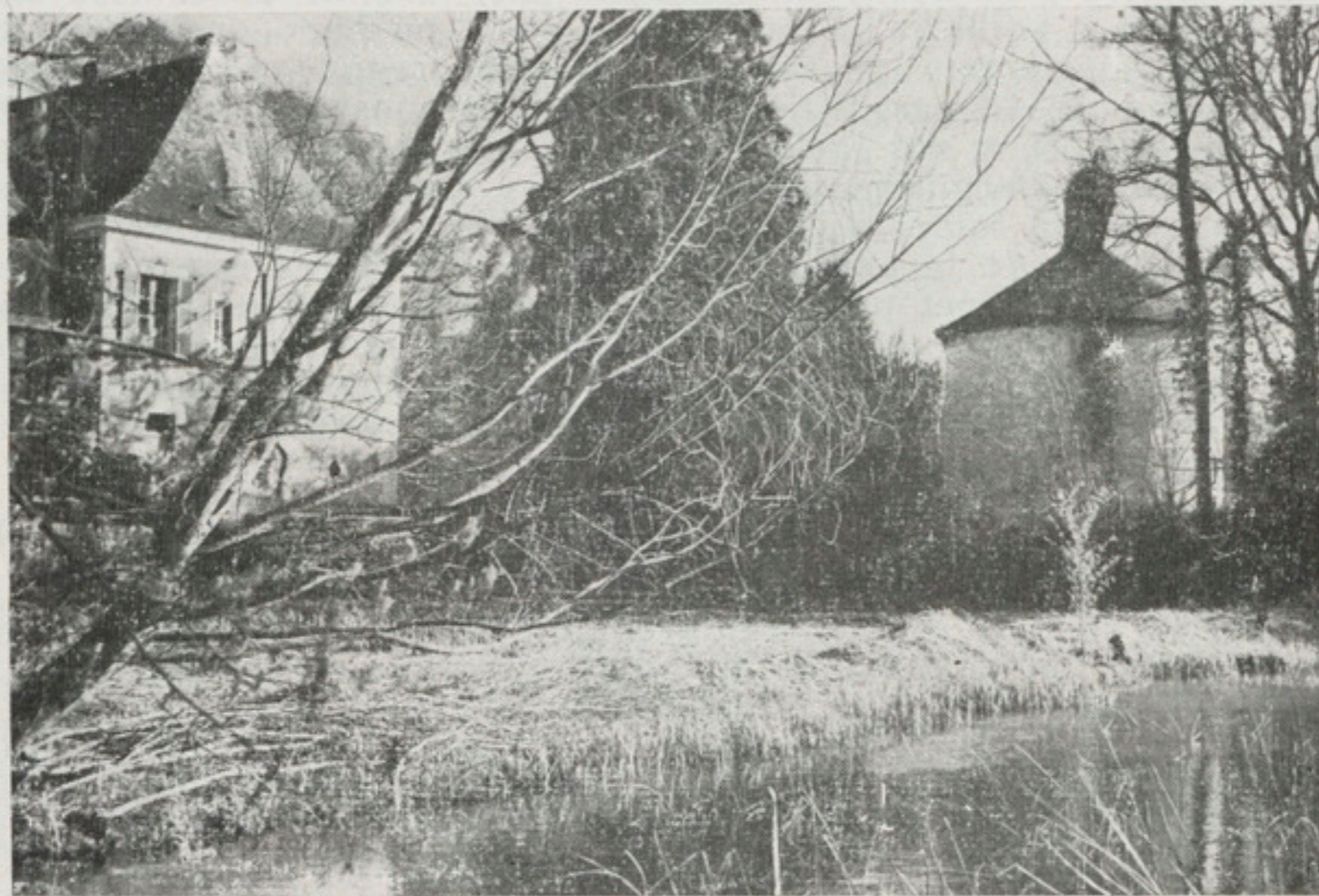
La Fuye du Château de Baché.

BACHÉ, Baché sur territoire d'Assay, Baché, nom encore porté par des gens, dont un père jésuite, Basché, selon l'orthographe de Rabelais.