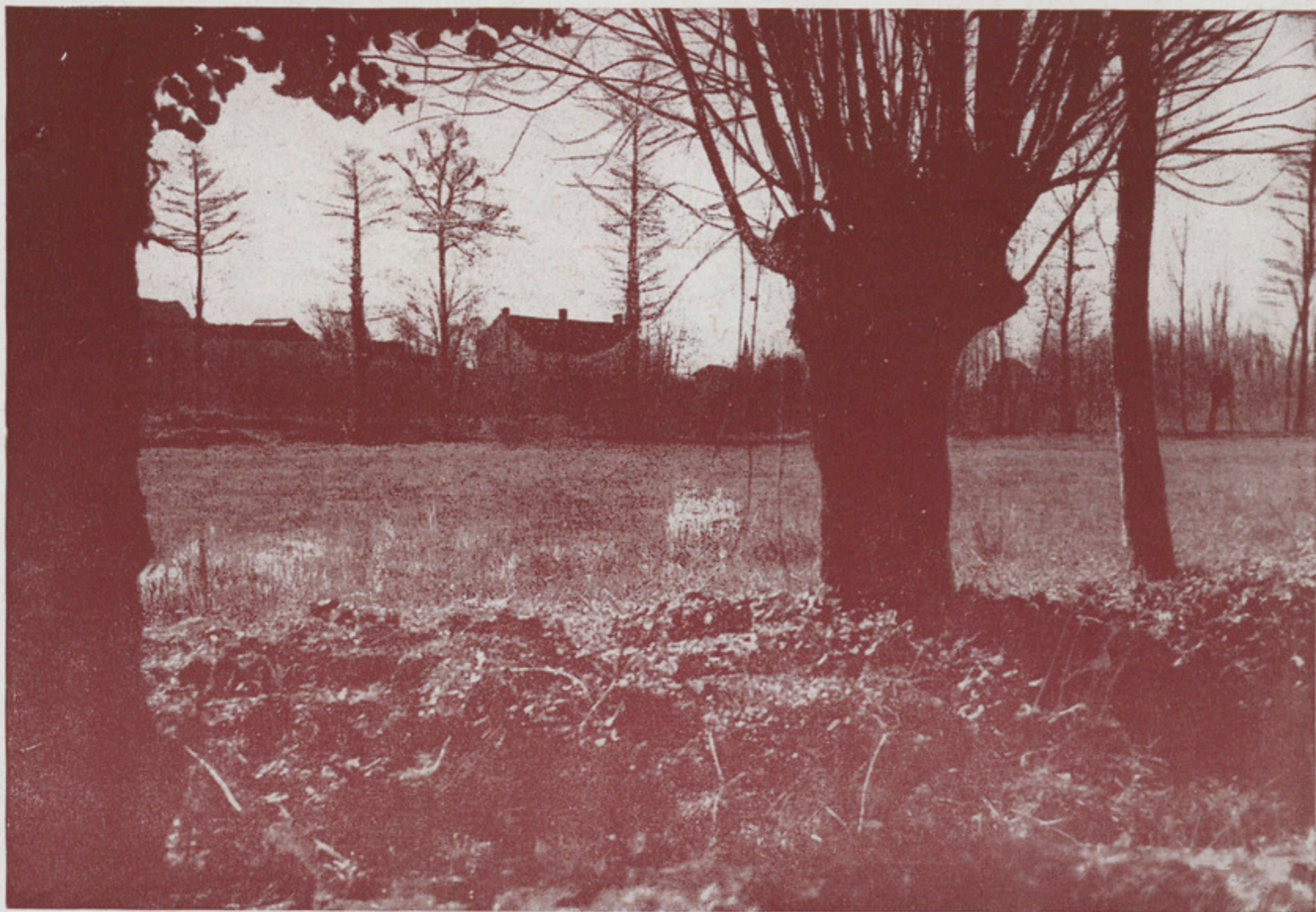
Vers le Gué de Vède et la prairie de la Saulaye